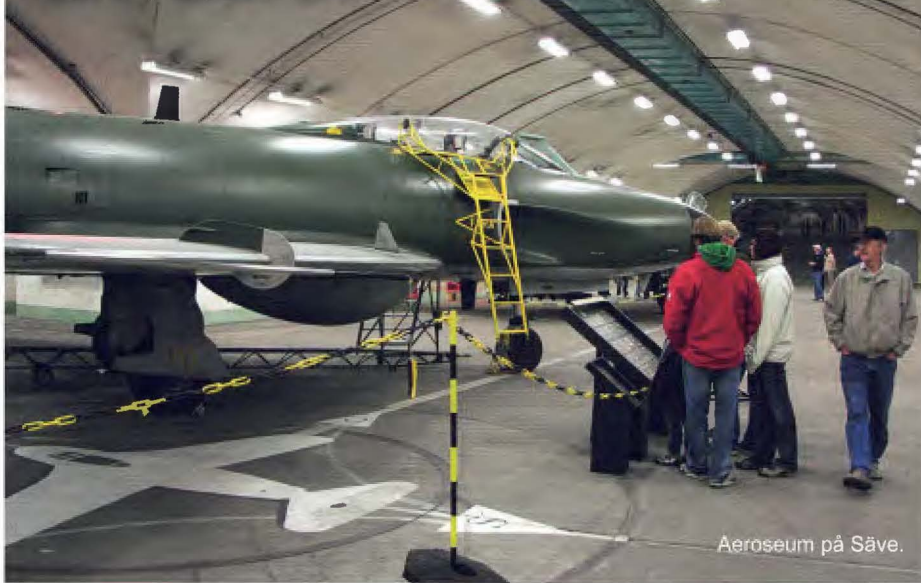
Aeroseum på Säve.

I regleringsbrevet för år 2005 gav regeringen (Utbildnings- och kulturdepartementet) Statens försvarshistoriska museer (SFHM), Statens maritima museer (SMM) samt Fortifikationsverket (FortV) ett likalydande uppdrag att redovisa konkreta förslag avseende bevarande av valda delar av det svenska försvarets kulturarv. Uppdraget skulle utföras gemensamt med Försvarsmakten. Huvudanledningen till uppdraget var att Försvarsmakten (FM) ville bli av med sin museiverksamhet.