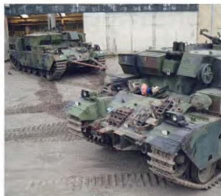
Arsenalen i Strängnäs.

Flygvapnet fick Aerozeum i Göteborg vilket gick att koppla ihop med de atomsäkra anläggningarna, Optand utanför Östersund där det även fanns en krigsbas och Krigsflygfält 16 i Brattforsheden (beredskapstiden). Dessutom tillkom efter